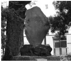
中村舜次郎の句碑