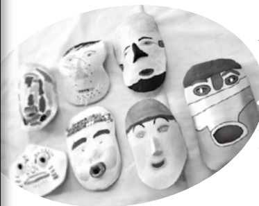
すみれの家での作品 づくり④と作品⑤