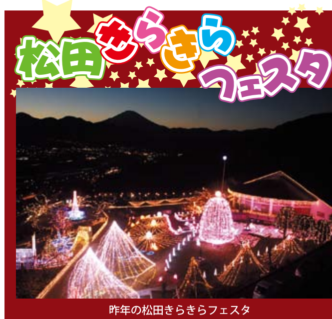
昨年の松田きらきらフェスタ

場所 西平畑公園(ハーブ館、子どもの館、散策路)、商店街など 期間 12月25日(水)までと1月11日(土)~13日(月・祝) 点灯時間 12月19日(木)までは午後5時~9時まで。20日(金)~25日(水)は午後10時、1月11日~13日は午後9時まで その他 ・ハーブ館売店 herb shop 午前9時~午後9時(20日からは10時まで) ・レストラン Rosemary ディナータイム:午後5時~8時30分(12月20日~25日は9時まで)。オーダーストップ:閉店30分前(お食事は1時間前)