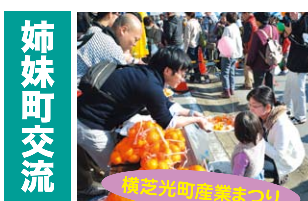
横芝光町産業まつり