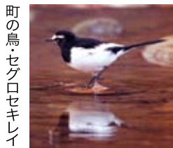
町の鳥・セグロセキレイ