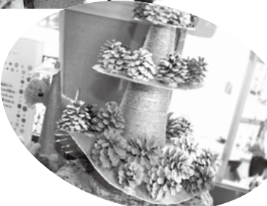
松ぼっくりを使ったのツリー 作り①と完成した作品②=コ スモス学園松田センター