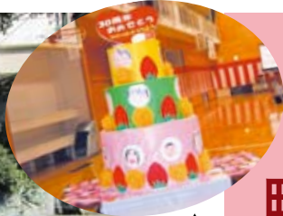
記念誌の挿絵をモチーフとしたジャンボケーキ