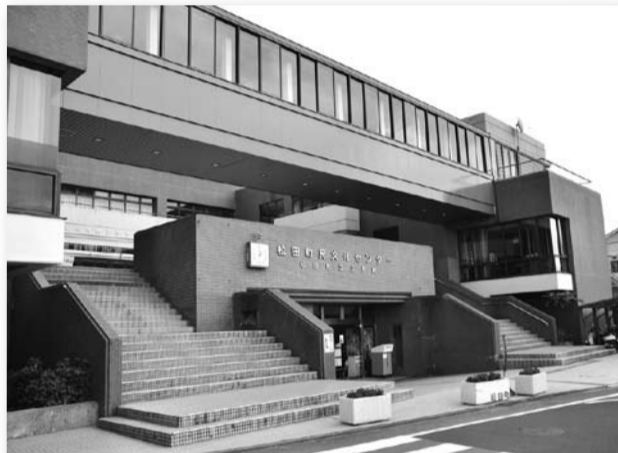
町内外からの利用がある町民文化センター