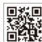
コロナワクチン ナビ

※町外の接種可能な医療機関は、厚生労働省の「コロナワクチンナビ」でも確認ができます