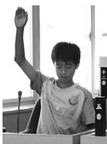
しっかり手を挙げて質問をしていました。

この他にも大型スーパーや自転車専用道路の設置などの質問や、ゆるキャラの作成を求める意見などもあり、議場では、本物の議会さながらの議論が展開されました。