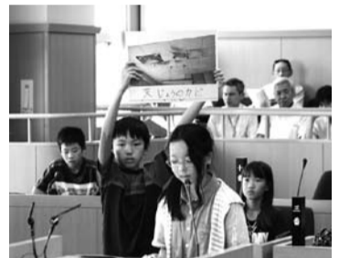
ブラカードで現状を訴える様子。児童が考えた工夫が随所に見られました。

今年で3回目となる子ども議会に松田小学校6年生の児童14人が参加しました。児童のうち2人が議長