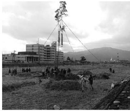
オンベを立てているダンゴ焼き場 (川音川)

自治会の各世帯に焼き鳥、綿菓子、かき氷の無料引換券と「ガラガラポン」の無料抽選券を配るなど多くの方が楽しく参加できる工夫をしています。 子どもたちや保護者による道祖神太鼓の音が響く中、ふれあい会によるバザーや模擬店の飲み物、焼きそば、ビールなどの販売も行い、夏の1日を楽しんでいます。