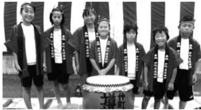
がんばって練習しています

仲町屋道祖神太鼓は、町がたぐさんの山車で賑やかだった頃から、今日まで続いています。小学生を対象に、普段の練習は月1回、行事の前は1週間に1回くらい続けて行います。