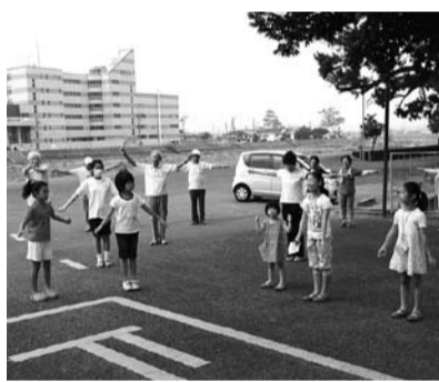
子どもも大人も夏休みのラジオ体操 (町立体育館前)