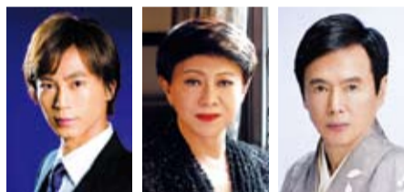
氷川きよし 美川憲一 森進一

締切り 10月6日(月) 必着 【問い合わせ】 企画財政課企画係 ☎(83)1222 (平日午前8時30分~午後5時15分) NHK横浜放送局 ☎045(212)2663 (24時間自動音声) ホームページ http://www.nhk.or.jp/yokohama/