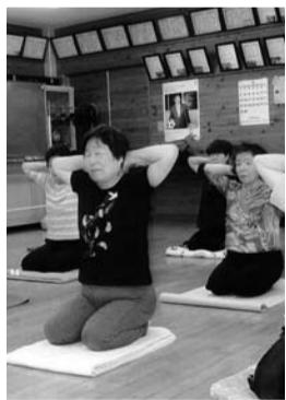
心と身体の調和を図ります

地域集会所施設をお借りして、講師の先生に自彊術を教えていただき、今年9月で10周年を迎えます。