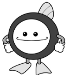
下水道 Mascot キャラクター「スイスイ」

下水道の役割や、整備の重要性などについての理解と関心を深め、下水道の普及とその活用促進のため9月10日を「下水道の日」と定めています。