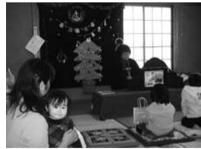
クリスマスおはなし会

活動は自治会と連携し、キックベースボール、陶芸教室、クリスマスのおはなし会、おはなし会や道祖神のおダンゴづくりなどを通して、幼児を含めた青少年と住民の交流を図っています。現在の会員数は59人です。