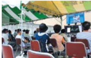
パブリックビューイングの様子。70人近くの観客が集まりました。→

7月24日(木)、全国高校野球選手権神奈川大会にて立花学園高等学校を応援するため、町民文化センター駐車場で180インチの大型スクリーンを使用して、横浜高等学校との試合でパブリックビューイング(※)を行いました。※大型スクリーンを通じてスポーツ観戦を行うこと