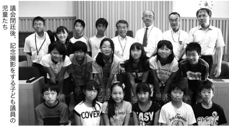
議会閉会後、記念撮影をする子ども議員の児童たち

となり他の児童は2人1組で順番に登壇し、通常の町議会と同じ形式で質疑応答を行いました。質疑では児童に身近な教育関係から福祉関係、商業振興、道路改修、防災対策など幅広く質問や提案がありました。