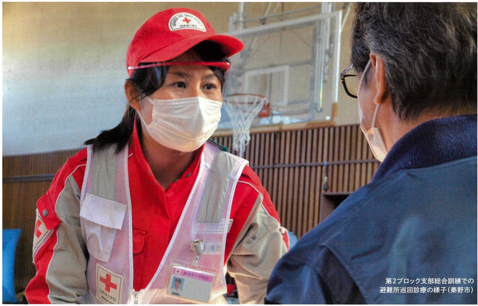
第2ブロック支部総合訓練での 避難所巡回診療の様子(秦野市)