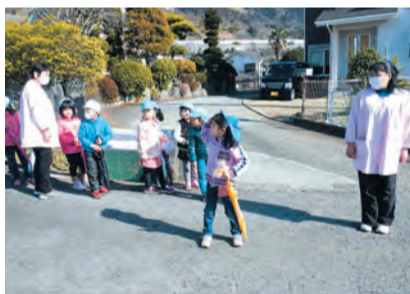
↑右見て、左見て、車が来ないか確認中。