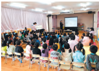
↑映像で交通ルールを確認しました。