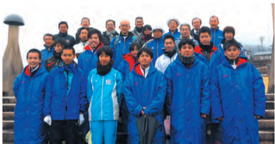
↑大会終了後、選手・スタッフそろっての記念撮影

昨年は降雪による影響で中止となった大会でしたが、今年は2月8日(日)に開催されました。 7区51・9kmを走る本大会では、選手だけでなく、サポートをしているスタッフが一丸となって大会に臨み、前回大会より順位を上げて、完走することができました。 松田町チームの記録は3時間7分49秒で全体26位、町村の部7位という結果でした。