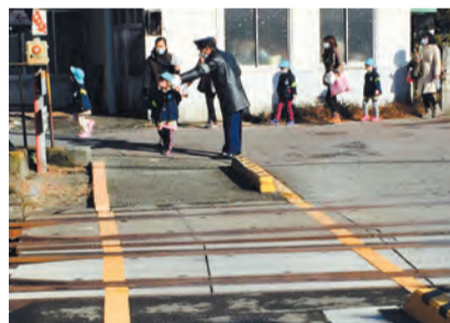
↑踏切も右と左を確認して。

1月16日(金)、松田幼稚園で、町交通指導隊の協力により、年長児を対象に交通安全教室を開催しました。また、2月4日(水)、さくら保育園は、松田警察署の協力を得て、同様に交通安全教室を開催しました。この教室は、新1年生となる園児に交通ルールを理解してもらい、安全に登下校できるようにするためのものです。