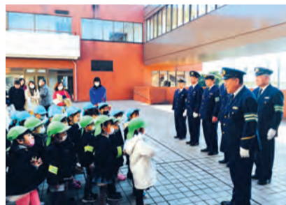
↑出発前に交通指導隊より注意がありました。