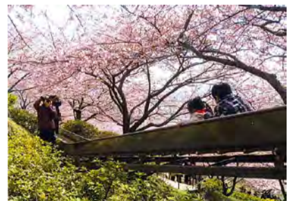
ジュニア部門 推薦 「桜のトンネルを行く」 柳下 大河(松田町)