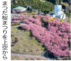
まつだ桜まつりを上空から