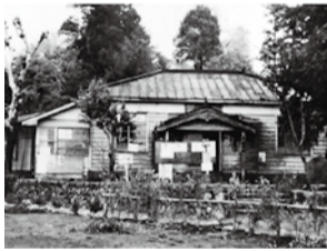
↑ 寄村最後の記念撮影（写真右）と合併直前の寄村役場（いずれも昭和30年撮影）

地域消費喚起事業（プレミアム付商品券の発行） 昨年実施したプレミアム商品券の金額より額面が20%上乗せされた商品券を平成27年度に発行します。27年度版は町内で使用できるものと近隣の町でも使える2種類のプレミアム付商品券を発行する予定です。