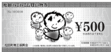
↑ 昨年発行したプレミアム商品券

地域消費喚起事業（プレミアム付商品券の発行） 昨年実施したプレミアム商品券の金額より額面が20%上乗せされた商品券を平成27年度に発行します。27年度版は町内で使用できるものと近隣の町でも使える2種類のプレミアム付商品券を発行する予定です。