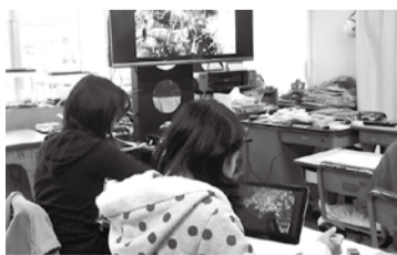
↑ 昨年度実施したタブレットを使った授業の様子。

平成26年度一般会計補正予算第6号も平成27年3月5日に議決しました。補正予算の内容は国の「地方への好循環拡大に向けた緊急経済対策」に関連した地域住民生活等緊急支援のための交付金を財源とした「松田町・寄村合併60周年記念事業」、「学校ICT推進事業」、「地域消費喚起事業（プレミアム付商品券の発行）」などを実施します。 また今回の補正予算では、地域住民生活等緊急支援のための交付金事業の年度内の執行が難しいため、翌年度に繰り越す制度を利用し、平成27年度に実施します。