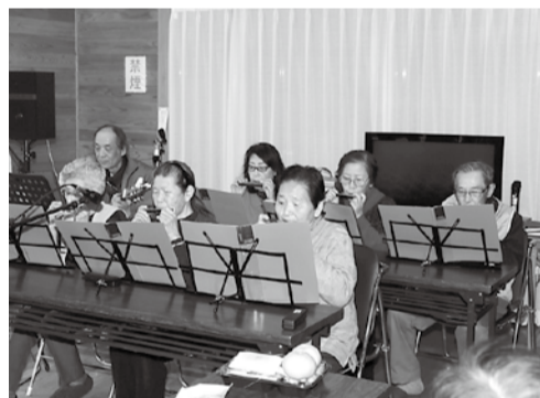
見事なハーモニカ

ゆめクラブが誇る「ハーモニカ同好会」はリーダーのギター伴奏に合わせて見事なハーモニカの音色を奏でていきます。写真では音が聞こえないのが残念です。