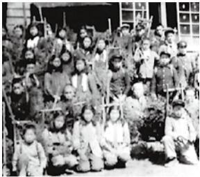
植林作業に出かける児童 寄国民学校