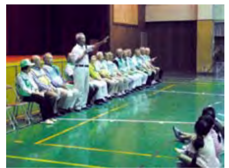
これからも、子どもたちを見守ってください

松田小児童会主催で、防犯ボランティアの方々を招いて日頃の感謝を伝える「ありがとう集会」が6月30日に行われました。集会の最後に、感謝の言葉が書かれた短冊を子どもたちからボランティアの皆さんへ渡しました。