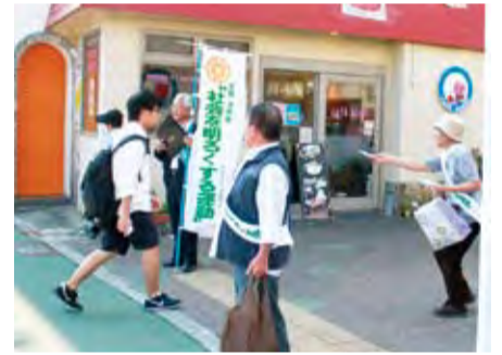
松田駅前啓発運動

7月10日、今年も保護司と松田町更生保護女性会の方々が、犯罪や非行を防止する啓発活動を新松田駅前などで行いました。