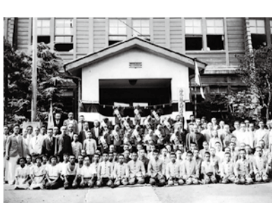
足柄上郡の国民学校から二宮金次郎像(写真中央上段)を供出する際の写真

松田町では、戦後70年を迎えるにあたり、戦没者、原爆死没者の冥福と世界の恒久平和を祈念し、下記の日時にサイレンを吹鳴しますので、黙とうをささげましょう。 ・広島原爆死没者への慰霊 8月6日(木) 午前8時15分 ・長崎原爆死没者への慰霊 8月9日(日) 午前11時2分 ・戦没者への慰霊(終戦の日) 8月15日(土) 正午