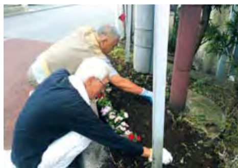
植栽を通じてつながりも生まれます

活用して、中沢自治会の方が早速花を植えてくださいました。通りがかった人が「きれいだね」と声をかけていました。