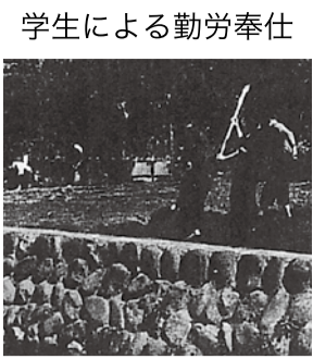
学生による勤労奉仕 グラウンド下を耕作する児童 松田国民学校