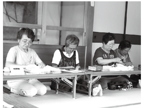
手と口を動かしています

地域の茶の間では、手芸に取組んでいます。手芸で手を動かし、おしゃべりで口を動かし、いつまでも若さを保っています。