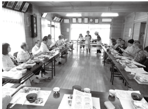
いつもおいしくいただいています

はつらつ昼食会は、健康面に配慮した食事を専門家である「ヘルスメイトまつだ」のみなさんから提供していただき、参加者で舌鼓を打つという趣向です。また、食事についての講演もあり、普段の食生活を見直す良い機会となっています。