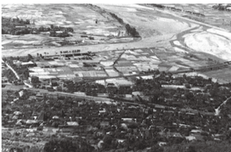
戦後間もない頃の松田町