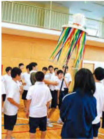
大鳥毛をきれいに回すのは難しい

毎年、松田中学校では大名行列について学ぶ授業が行われています。生徒たちは、保存会の方々から大名行列の歴史を聞いた後、道具を持ってみると、体験することを通して学んでいます。