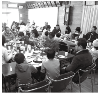
楽しいひと時を過ごしました

お年寄りから小学校低学年まで、今では珍しくなった木製の杵と臼による「お正月餅つき大会」を行いました。餅つきの後は、地域集会施設の中でカラオケ大会や松田音頭の披露など、盛りだくさんの出し物が行われ、年代を越えた交流が楽しく行われました。アツと言う間の楽しい半日でした。