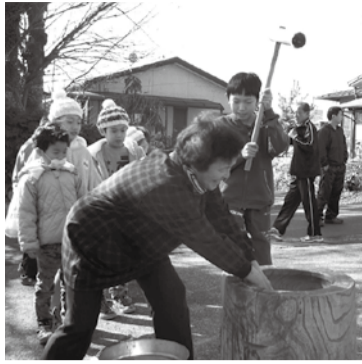
年代を越えたお餅つき

城山自治会では、城山地域集会施設を「地域の憩いの場」と位置づけ、様々な年代の方々に気軽にそして幅広く利用していただき地域のコミュニケーションに役立つよう心がけています。今回は、その中で特に活発な活動をしている「城山ふれあい会」「城山ゆめクラブ」「城山子ども会」の3つの活動を紹介します。