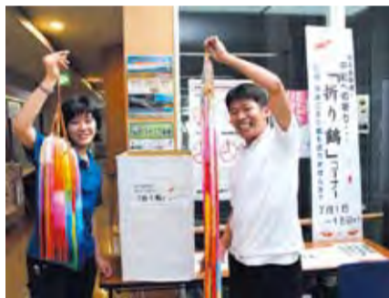
たくさんの折り鶴をいただきました

これらは、折り鶴は、原爆犠牲者の慰霊と核兵器廃絶や世界の恒久平和の願いを込め、広島・長崎両市に贈られます。