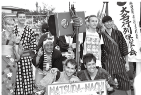
昨年国際交流の様子

外国人観光客の方々に日本文化をより味わっていただけるよう、浴衣や甚平を着ていただければと考えております。そこで、昨年もお願ひしておりましたが、ご家庭にある浴衣や甚平を『無償提供しても構わない』という方がいらっしやいましたら、8月14日（金）までに問い合わせ先へご連絡