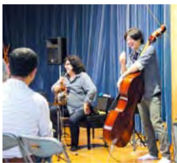
トークでは笑いが起こる場面も

近に感じられました。なお、今回の売り上げの一部は、子どもたちのために町に寄付をいたしました。