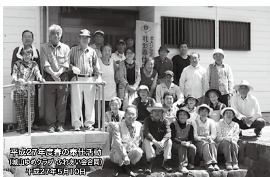
地域の中で奉仕の心が育っています

人神輿のお旅処です。同時に子ども神輿の宮出し処でもあります。写真は宮出し直前の子どもたちの写真ですが、子どもは地域の宝、大人全員が、未来に向けて、導き、育てていかなければならないと考えています。