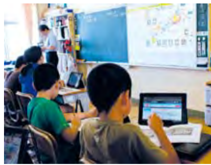
日本史の授業の様子

7月13日、夏の交通事故防止運動に伴い、町交通指導隊出陣式を行いました。交通指導隊員は、松田町長、松田警察署長、足柄交通安全協会長から激励の後、夜間街頭立哨を実施し、交通安全の啓発活動を行いました。