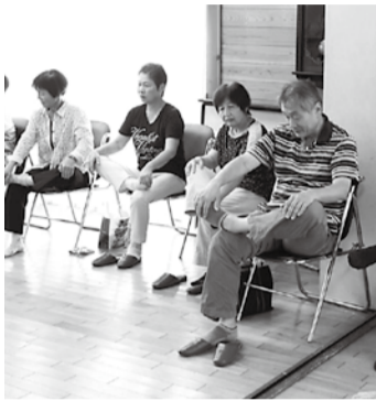
身体と心もほぐしています

健康は体の管理からというところで、定期的集まり、ストレッチで体を柔らかくする運動を行っています。