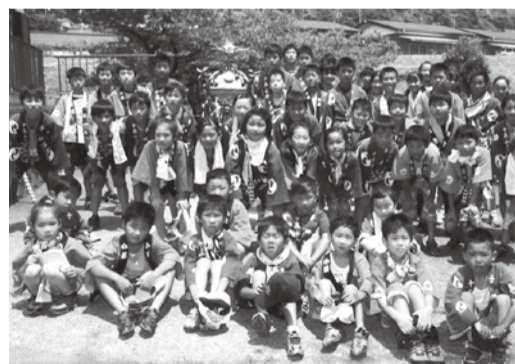
大きく育て 地域の宝