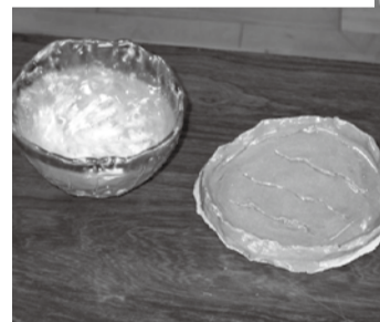
出来上がった作品 いい仕事してますね～