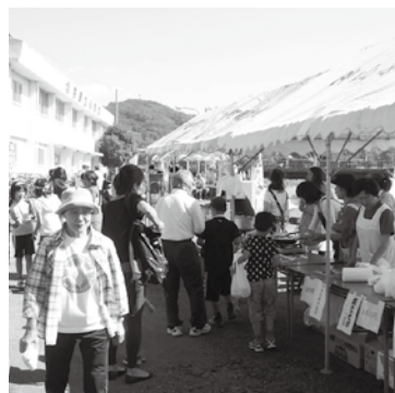
安くて美味しい!模擬店

松田スポレク祭(町民運動会)は、松田町体育協会主催で、町民誰もが自由に参加でき、安全で健康的なスポーツを通じ、地域のコミュニケーション