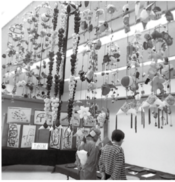
作品展示・展示ホール

舞台発表、作品展示、実演の3部門で構成されています。今年度は新企画として立花学園高校軽音楽部、小田原マーチングバンドの演奏を予定しています。