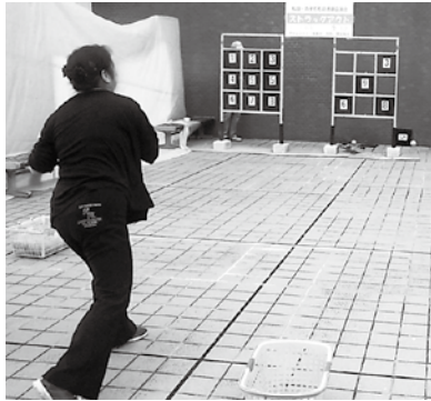
体験コーナー ストラックアウト