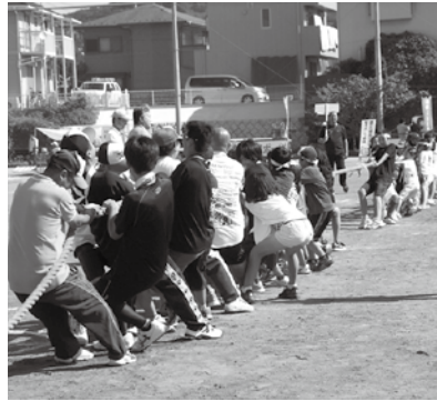
みんなで力を合わせて！綱引き