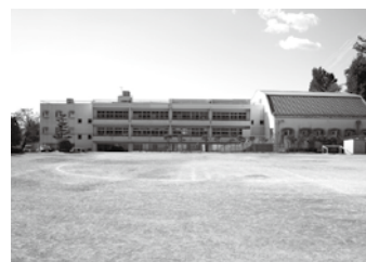
昭和49年完成の松田小学校

① 安全保障関連法案は、国民の理解が得られるよう十分な議論、審議が尽くされることを望む。外交・防衛等の分野は国の専権事項であり、首長としての見解は差し控える。 ② 町では、介護支援の住宅改修費、重度障害者住宅改良費助成、スマートハウス整備促進事業補助など行っている。 また、木造住宅耐震改修工事費補助も行っているが、推進策として耐震工事に関連した住宅環境向上のリフォーム助成制度の創設を研究する。「空家の解体費用補助」や「空家の改修費補助」などについて、「空家バンク」に登録された建物を対象に、住環境整備の補助制度設計の調査・研究を進めている。