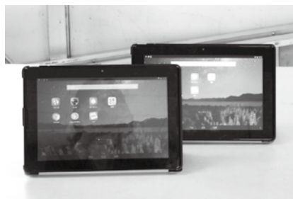
導入したタブレット端末

① この補助金は、学校施設環境改善交付金として校舎等の耐震補強、防災機能強化、老朽化によるトイレ改修や空調整備などの大規模改修事業に充てられるものである。