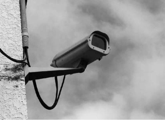
新松田駅前の防犯カメラ