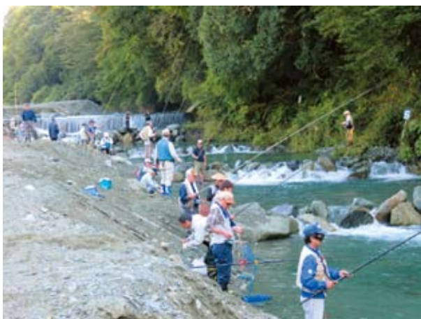
10/4 中津川で開催された清流釣り大会

しかし、残念ながら近年は、レジャーの多様化により年々来客数が減少しているのが現状です。昨年度より、町や関係機関と協力し「寄特産サクラマスの燻製」を販売しております。サクラマスは、刺身や塩焼きにしてもおいしいと好評です。ぜひ、皆さんも一度食べてみてください。