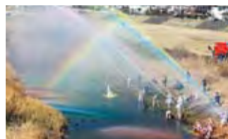
酒匂川への一斉放水の様子。色とりどりの水が放水されると川に虹が架かりました