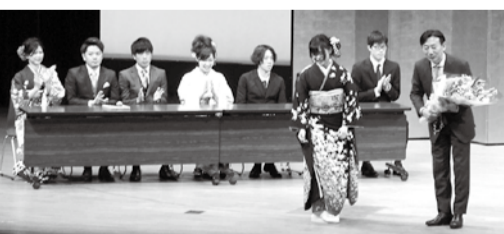
新成人より花束が渡されました