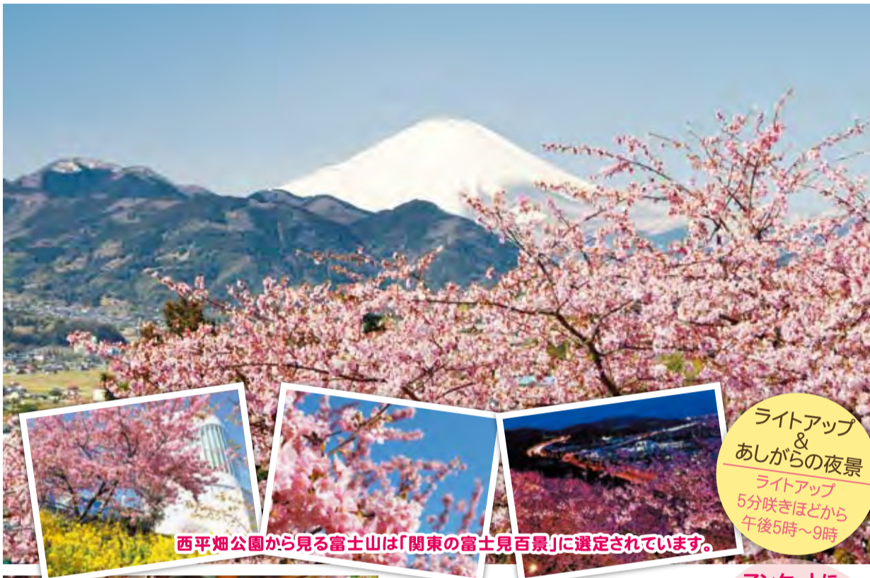
西平畑公園から見る富士山は「関東の富士見百景」に選定されています。

ライトアップ & あしがらの夜景 ライトアップ 5分咲きほどから 午後5時～9時