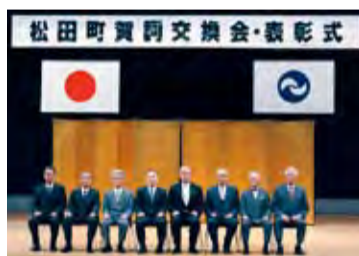
参加者そろって記念撮影