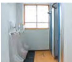
全面的にリニューアルしたトイレの様子

松田中学校の生徒用トイレが4カ月間の工事を経てリニューアルしました。各トイレは温式便座となっており、洗浄器付トイレも各階男女一台ずつ配備されています。