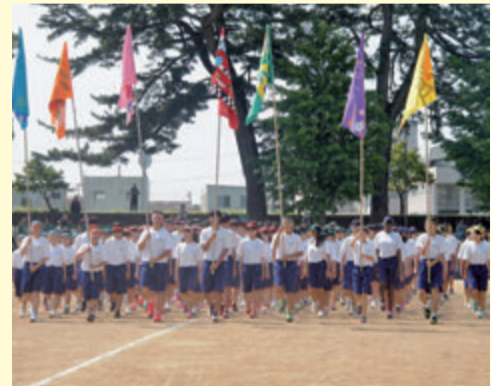
松田中学校 体育祭 (5月21日)

町内の小中学校が5月に運動会や体育祭を開催しました。爽やかな青空のもと、児童・生徒は練習の成果