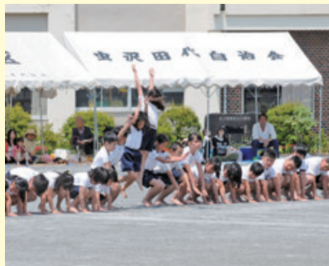
寄小中学校 運動会 (5月21日)

町内の小中学校が5月に運動会や体育祭を開催しました。爽やかな青空のもと、児童・生徒は練習の成果