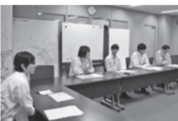
今年の新入職員も積極的に発言しています