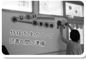
特技を生かして 読書旬間の準備