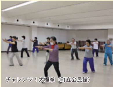
チャレンジ!太極拳(町立公民館)