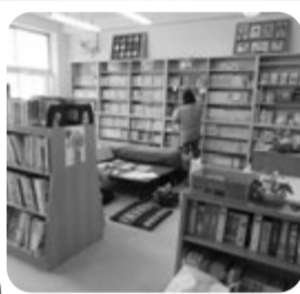
↑寄小中学校の図書室 ←読み聞かせの風景

「ぱたぽん」さんが発足し、10年が経過しました。はじめは、少人数でスタートしましたが、現在は、10名のボランティアさんが、「読み聞かせ」と「修理・整備」など二班に分かれ活動しています。読み聞かせは、各学年月1回、2人体制で行います。会議などの話し合いは、月1回行い、その後に修理や整理、環境づくり、イベントの準備などをします。