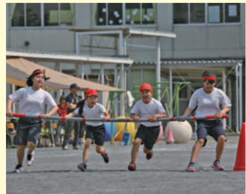
寄小中学校 運動会 (5月21日)