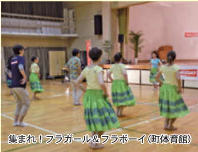
集まれ!フラガール&フラボーイ(町体育館)