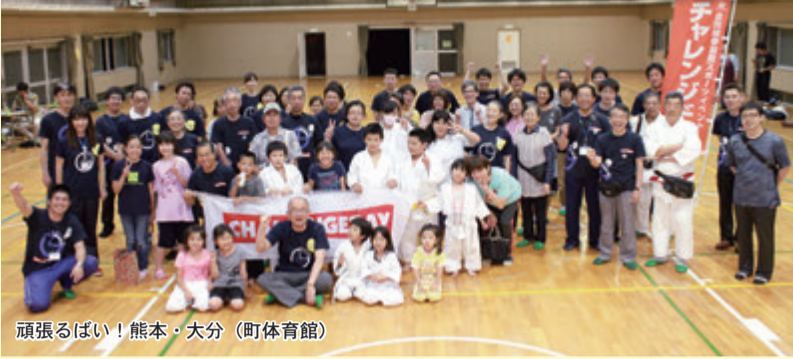
頑張るばい!熊本・大分(町体育館)