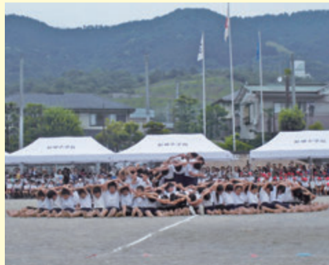
松田小学校 運動会 (5月28日)