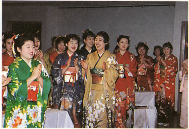
久しぶりの仲間との楽しい懇談会（昨年の成人式より）

十五日の「成人の日」にはみなさんの門出をお祝いし、町民文化センターで午前10時より成人式を行いますので、ぜひご参加ください。