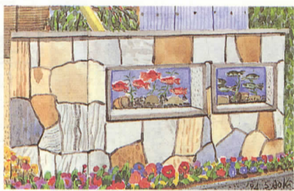
都市との交流の拠点、ふれあい動物村(左)と市民農園(下)