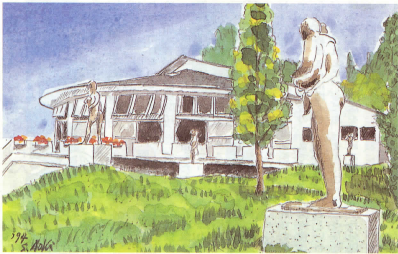
松田山全山公園化の一つの核となる子どもの館(上)と街角水族館(右下)