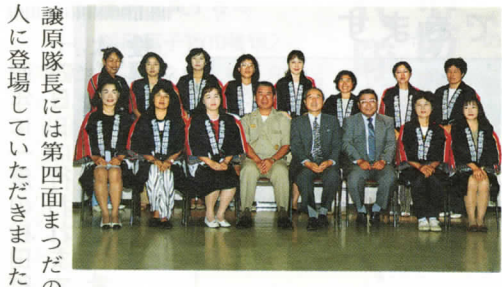
譲原隊長には第四面まつだの人に登場していただきました。

国府津松田断層 地震国日本、大きな地震が続いています。松田町にも直下型地震を引き起こすといわれる、国府津松田断層が走っています。通産省地質調査所が全国五か所で調査を行う、いつ活動期に入ってもおかしくないといわれる活断層に含まれています。すでに調査に入っており、今年度中に結果がまとめられる予定です。