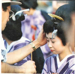
「暑いですね。」があいさつ代わりだった今年の夏。まつだ観光まつりも燃えました。