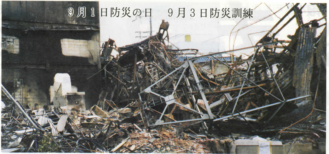
9月1日防災の日 9月3日防災訓練