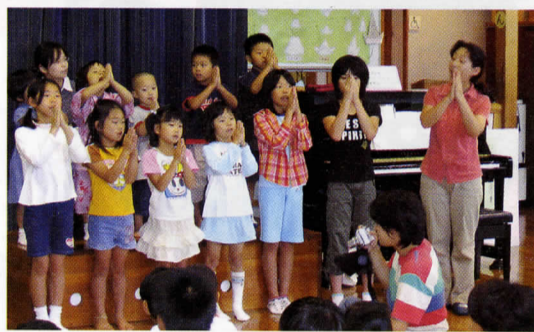
▲昨年のサークル共演会