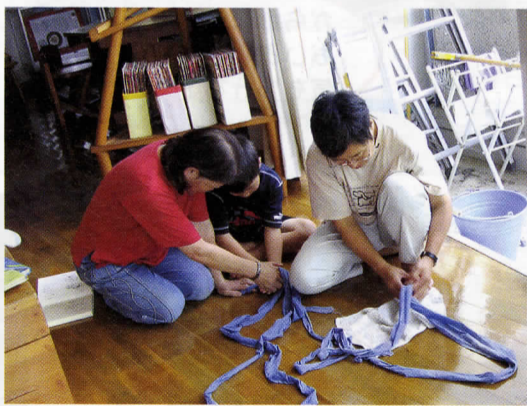
▲昨年のこまひも作りの様子