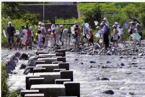
▲昨年の生きもの講座 (水中の生き物)

日時 7月21日(土) 9:30~11:30 場所 自然館 草や木のくきや葉など、植物のせんいを使 って、はがきを作ってみよう。