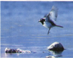
町の鳥：セグロセキレイ

小さな役場では大変珍しい作業であり、貴重な体験でもありました。やればできるものだという自信が職員にもできたことでしょう。