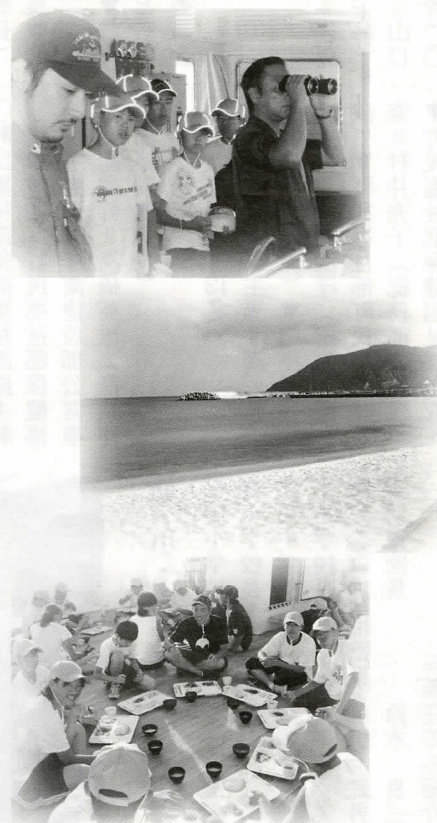
※写真は、 昨年の体験研修の様子

秦野市・中井町・大井町・松田町の1市3町では、広域行政推進協議会を構成し、行政事業等さまざまな相互交流等を進めています。中学生の交流事業として秦野市で実施している「青少年交流洋上体験研修」に、今年度から松田町の中学生も参加できるようになりました。この経費の一部には、町からの補助が出ています。 研修では、学校法人東海大学の海洋調査研修船「望星丸」に乗り、駿河湾を航行しながら、海洋観測や星空観測、大島・新島の美しい海での海水浴などを行います。大自然、そして船上での貴重な体験を通じ、近隣市町の仲間たちと楽しく遊び・学びながら、交流を深めませんか。中学生の皆さんの参加をお待ちしています。 【問合せ】生涯学習課 ☎83-7021