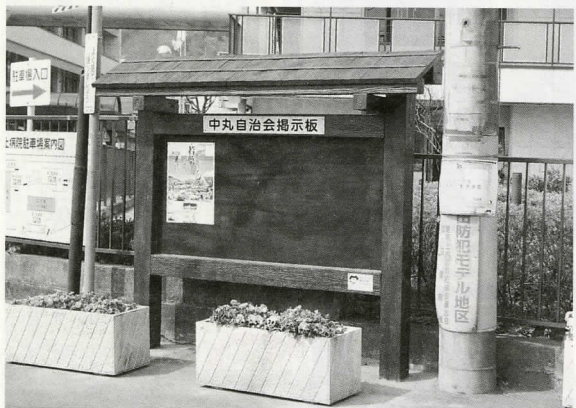
新しくなった中丸自治会掲示板