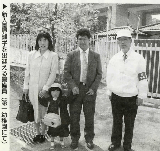
▶新入園児親子を出迎える警備員（第一幼稚園にて）

近年多発する子どもを狙った犯罪を未然に防ぐため、町では、昨年4月から町立小・中学校に警備員を配置しました。警備員は毎朝校門前に立ち、登校する児童・生徒たちを出迎え、下校時間まで、学内に不審者や物はないかなど巡回を行っています。今では、子どもたちの安全を図るだけでなく、近隣住民の皆さんにとっても心強い存在となっています。さらに「安全・安心のまちづくり」を進めるため、新学期から各幼稚園にも警備員の配置を拡大しています。