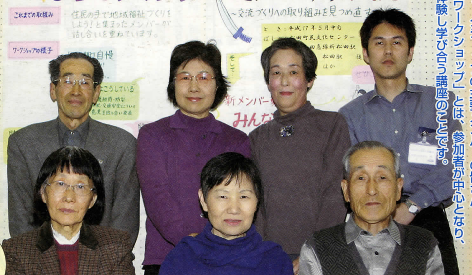
ワークショップの主要メンバーの皆さん。「ワークショップ」とは、参加者が中心となり、体験し学び合う講座の場です。