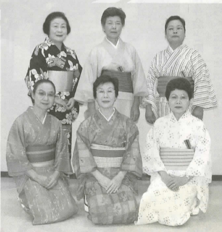
▶着付けを行ってくださる体協のレクリエーション部の皆さん

に一度の年中行事として、続けてこられて良かった」と思うそうです。唯一気がかりなのは、着付けボランティアの高齢化です。伝統ある祭り、そして大名行列を残していくためにも、ぜひ多くの皆さんに新たにボランティアとして参加していただけたらとおっしゃっていました。ペテランの皆さんも、最初は着付け初心者だったそうですので、興味を持たれた方は、ぜひ気軽に参加してみたいかがでしょうか。