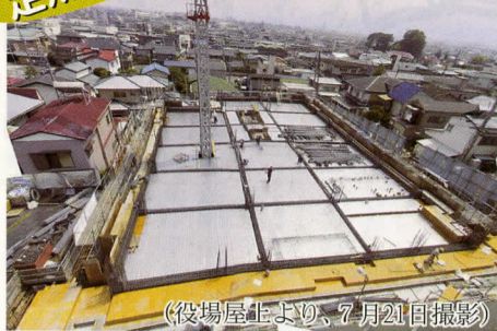
(役場屋上より、7月21日撮影)

現在、2階床・梁部分の鉄筋を組立立てています。床状に金属質のものが見えますが、これは2階床の底面に相当する部分で、床のコンクリートを打つための鋼製の型枠です。 また、徐々に建物周囲に外部作業用の足場が立ち上がってきています。 【問合せ】庶務課管財班 ☎83-1221