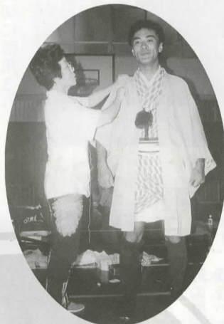
◀弓の演技者の衣装を着付ける様子。

30年以上にわたり毎年、演技者の衣装の着付けてくださっているのが、「体協レクリエーション部」の方々です。現在は6名ほどの有志で80名以上の着付けを行うため、本番前は大忙しです。衣装の不備がないか点検をしたり、着る人に合