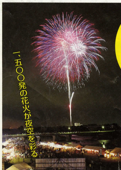
「一五〇〇発の花火が夜空を彩る」