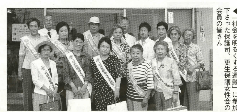
◀「社会を明るくする運動」に参加下さった保護司、更生保護女性会の会員の皆さん

皆さんは、更生保護女性会をご存じですか。この会は女性の立場から犯罪のない明るい地域社会をつくるために結成されたボランティア団体で、更生保護事業の推進、地域社会の浄化と防犯意識の普及・徹底に努めることを目的として活動しています。全国で約1,300もの地区会があり、20万人以上の会員がいます。足柄上地区では、5町が一体となって活動しており、松田町では15名の会員がいます。保護司や民生委員経験者など、「少しでも、地域のために役立てたら」といったボランティア精神を持った方が多いので、うまく活動が進んでいるのではないかと考えています。 主な活動には、少年院や更正施設、福祉施設などへの慰問・奉仕、活動に共通点の多い保護司との合同研修会や各地区更生保護女性団体等交流、「社会を明るくする運動」など強調月間に合わせた啓発活動などがあります。 皆さんが、普段の生活を送る中では、犯罪を犯してしまい、更生を目指す子どもたちと接する機会が、あまりないと思いませんか。慰問などで少年院等を訪問すると、家庭的に恵まれなかった寂しさを抱える子どもたちが多いせいか、慰問で時折にしか訪れられない私たちにも親や家族のように、親しく話しかけてきます。自分たちを気にかけ、その更生を願い手助けを行う私たちのようなボランティアの存在があることを知ってもらおうと、再犯を防ぎ、更生し新たな人生を送ってほしいと願いながらこのような活動を続けています。 会員の高齢化や地域での活動の場の減少など、会として抱える課題もありますが、時代の変化に合わせて、次代を担う青少年の育成や過ちに陥った人たちの更生を手助けすると共に、明るい社会づくりに向けての地域活動に努力していきたいと思