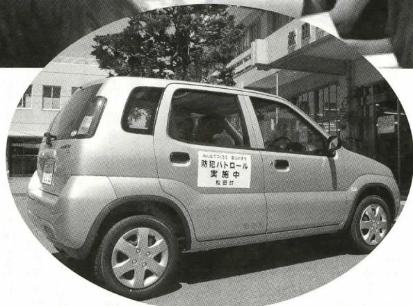
▲役場の庁用車には、「防犯パトロール実施中」の黄色いマグネットを貼り、犯罪の抑止力となるよう努めています。