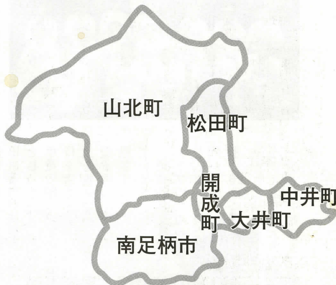
▲1市5町の世帯数は、37,568世帯、人口は111,935名、総面積は、342.62平方キロメートルで、県内では横浜市に次いで2番目の広さとなります。（平成16年6月1日現在）

各市町で行っている事務事業についての問題点や一元化に向けての相違点課題について判