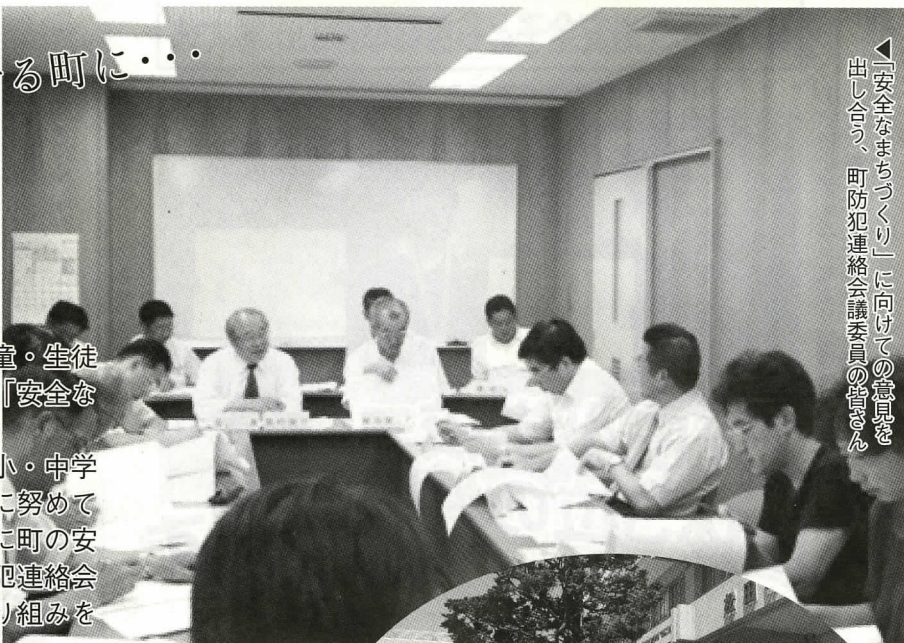
「安全なまちづくり」に向けての意見を話し合う、町防犯連絡会議委員の皆さん

昨年3月に起きた通り魔殺傷事件や全国各地で起きている児童・生徒を巻き込んだ犯罪の多発といった状況を考え、町では、今年度「安全なまちづくり」に取り組んでいます。