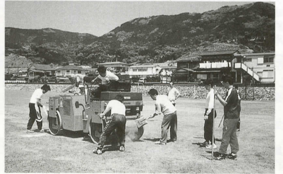
グラウンド整備を進める役員・父母会