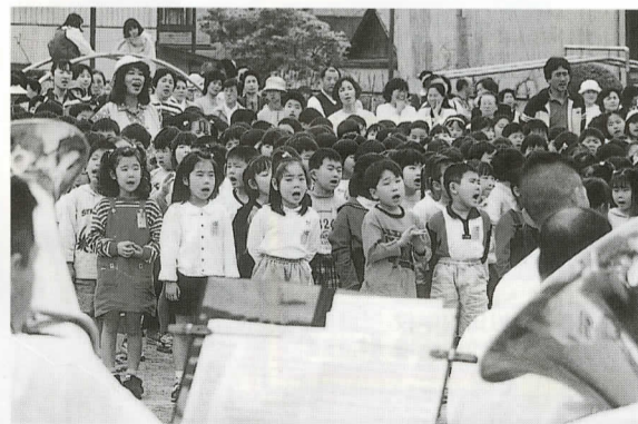
少年高齢社会を迎えるための計画づくりを進めます。(県警音楽隊の演奏に合わせて歌う松田小学校児童)

3926人の皆さんの声が届きました 自治会(区)役員と民生委員の方々の協力をいただき、全世帯を対象に実施した「町民意識調査」。皆さんのご理解により、89.8%と極めて高い回収率となりました。 この調査は、回答者が世帯主や男性へ偏ることなく、幅広い層からご意見が伺えるよう、1世帯につき20歳以上の方1人を、年代比率によりコンピュータで抽出して実施しました(平成11年5月10日現在の住民基本台帳から抽出)。調査表は4374人に届けられ、89.8%に当たる3926人から回答をいただきました。最終ページに設けた意見欄には、回答者の17.9%に当たる703人から町づくりに関する提言や、役場 の仕事に対する苦言や助言などが寄せられました。 さらに、21世紀を担う若い世代の感性から町づくりのヒントを得るため、松田中学校と寄中学校の3年生全員(163人)にも、同じ調査に協力していただきました。 現在、調査内容の集計と分析を専門業者に委託しています。その概要については、本紙9月号から随時報告していきます。調査結果は、平成13年度から10年間にわたって町政を計画的に運営するための指針となる、町の総合計画策定の基礎資料とさせていただきます。 担当 企画財政課 ☎83・1222