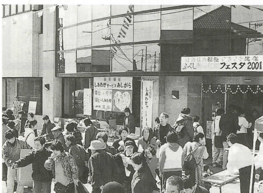
毎年大勢の来場者でにぎわう会場 (昨年のフェスタより)

今年もより多くの方々に健康と福祉についての理解を深め、身近なものとしてとらえていただくことを目的に「ほのぼのの福祉、いきいき健康! ふくしあったかフェスタ2002」を開催します。