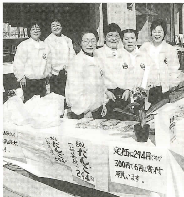
お待ちしております!

開催日: 平成14年1月27日(日) 会場: 健康福祉センター及びその周辺 時間: 10:30~15:00 内容: 福祉バザー・294だんご販売 体脂肪測定・福祉団体コーナー 焼きいも・駄菓子販売など その他催し物が盛りだくさん! 主催: 松田町社会福祉協議会 問合せ: ☎ 82-0294