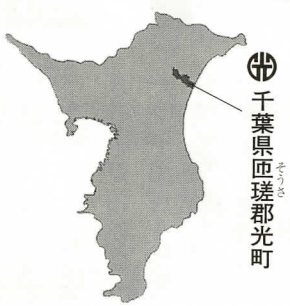
千葉県匝瑳郡光町

町の面積33.31kmの約7割が農地と山林で占められている。気候は、夏涼しく冬暖かい温暖な海洋性である。