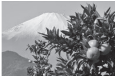
みかんは全国の方に人気です！

それと同時に、お礼の品についても種類を増やし約20種類の品をご用意したところ、全国から申し込みがあり、平成27年度（7月17日～翌3月31日）は4,877件、約7,900万円のご寄附をいただきました。