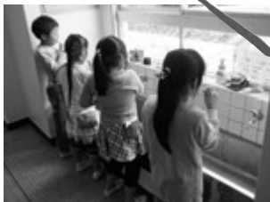
寄小学校での歯みがきの様子

いつまでも元気な歯でおいしいものを食べ続けるために、皆さんもぜひ「8020」を目指しましょう。