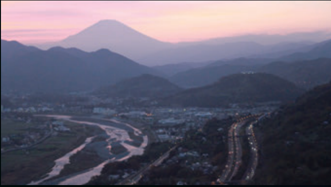
夕暮れのピンクから夜の藍色へ、刻々と移り行く空のグラデーションと富士山

編集・発行 松田町政策推進課 〒258-8585 松田町松田惣領 2037 番地 ☎0465-83-1222 [fax]0465-83-1229