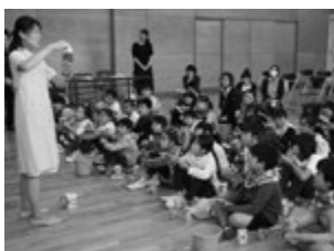
寄小学校学校保健委員会での歯みがき指導の様子