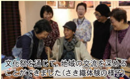
文化祭を通じて、地域の交流を深めることができました（さき織体験の様子）

10月22日・23日に文化センターをメイン会場に第43回町民文化祭を開催しました。墨絵・生け花・手芸・真などの作品発表や、演奏の舞台発表が来館者の目を惹きつけ、町の文化活動の多彩さを感じた2日間となりました。スタンブラーにはたくさんの子どもが参加しました。