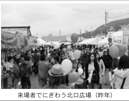
来場者でにぎわう北口広場(昨年)