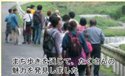
まち歩きを通じて、たくさんの魅力を発見しました

10月1日に寄で第2回まち歩き&ワークショップを開催し、24人が参加しました。やまびこ館から龍王寺までの道のりを寄り道しながら地域資源（お宝）を発見し、寄を紹介する標語を出し合いました。「自然に寄った生活やどりき」「暮らし達人の里やどりき」など、たくさんの意見が出ました。