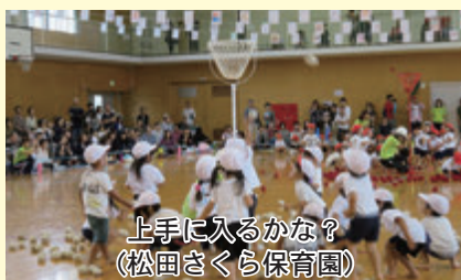
上手に入るかな？（松田さくら保育園）

松田幼稚園と寄幼稚園と松田さくら保育園で運動会が行われました。成長した子どもたちの姿に、保護者からは大きな声援と拍手が送られました。