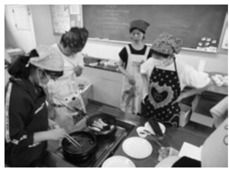
調理実習補助の様子

② 保護者による学習ボランティア 学習ボランティアは、調理実習やミシン作業の補助をします。今年、一年生や二年生の家庭科の授業に来ていただきました。また、英語の音読・英作文の補助・国語書写の補助など協力してくださいます。