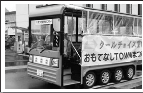
まつだ観光まつりで運行したEVバス 最高時速は15kmとゆっくりです。

町では5月に、環境省が進める温暖化対策運動「COOL CHOICE (クールチョイス：賢い運動)」に賛同する宣言を行いました。