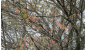
色づきはじめて桜の葉