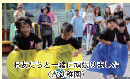
お友だちと一緒に頑張りました（寄幼稚園）