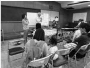
歯の衛生週間での8020運動推進員活動の様子