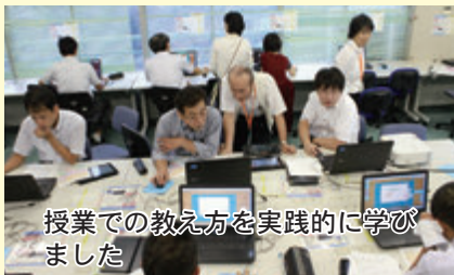
授業での教え方を実践的に学びました

教育の質の向上を目指すため、町ではICT教育を推進しています。9月30日には松田小学校で、小・中学校の教職員がプログラミング研修に参加し、学校教育におけるプログラミング教育のあり方と、実際のプログラミングを体験しました。