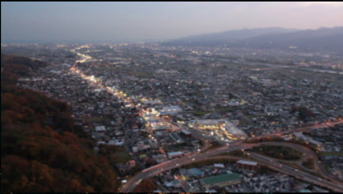
日が沈んだ後に足柄平野に灯る優しい灯り