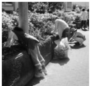
雑草をとるボランティアの皆さま

今年、除草作業に延べ56名、7月の大掃除には25名の参加があり、校舎内がすっきりと気持ちのよい学び舎になりました。また12月の大掃除にも多くの保護者の方にボランティアをお願いする予定です。大掃除の際は、生徒と一緒に校舎内の掃除をします。校舎も心もびかびかに。