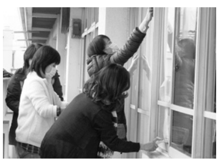
大掃除で窓ふきをするボランティアの皆さま (写真は、昨年12月の様子です。)

④ 修繕ボランティア 校舎内の不具合箇所は、地域にお住まいのボランティアさんに修繕をお願いし、とても助かっています。