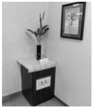
昇降口に飾られる生け花

松田中学校を訪問すると、生け花が目に入ります。昇降口では、素敵な生け花が生徒を迎えています。生け花ボランティアの活動は、長い歴史があるそうです。心と日頃の環境づくりにもボランティアさんのやさしい心が、来校者の目にとまります。