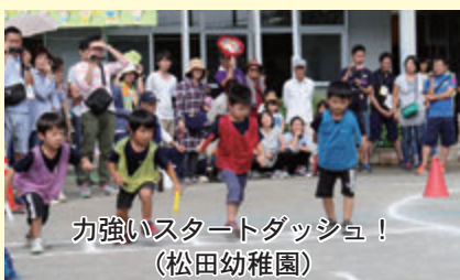
力強いスタートダッシュ！（松田幼稚園）