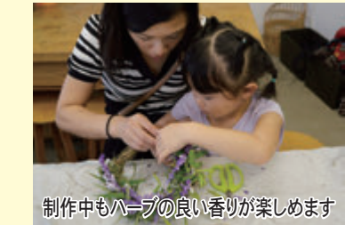
制作中もハーブの良い香りが楽しめます

10月8日～23日に松田山ハーブガーデンで秋のハーブフェスティバルが開催されました。紫色や赤色のセージ類が秋の空に映え、記念撮影をする方々にぎわいました。アメジストセージのリース作りは、親子で楽しめるとあって、好評でした。