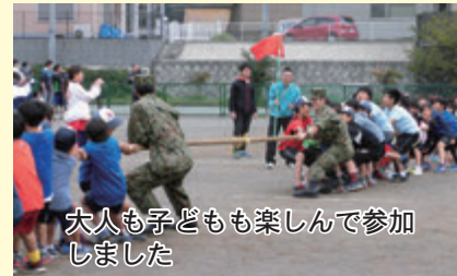
大人も子どもも楽しんで参加しました

10月10日に、松田中学校グラウンドをメイン会場として、松田スポレク祭（町民運動会）を開催し、634人が参加しました。例年盛り上がるリレーでは、各チームを代表して走る選手たちの迫力ある名勝負に多くの声援が上がり、会場が一体となりました。