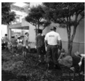
除草作業ですっきりした校舎

② 保護者による学習ボランティア 学習ボランティアは、調理実習やミシン作業の補助をします。今年、一年生や二年生の家庭科の授業に来ていただきました。また、英語の音読・英作文の補助・国語書写の補助など協力してくださいます。