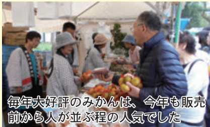
毎年大好評のみかんは、今年も販売前から人が並ぶ程の人気でした

東京都港区で10月8日・9日に開催された「みなと区民まつり」に松田町が参加し、豊かな自然が育んだ産物の販売を通じて、町の魅力をアピールしました。みかんやお茶、鹿シチュー、柑橘類の鉢植えなどは、都心の方に特に好評でした。