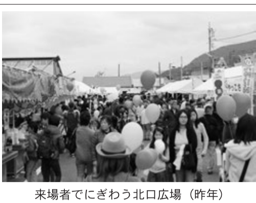
来場者でにぎわう北口広場(昨年)