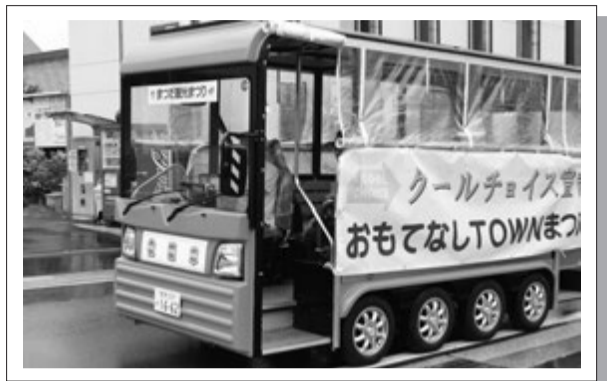
まつだ観光まつりで運行したEVバス 最高時速は15kmとゆっくりです。

町では5月に、環境省が進める温暖化対策運動「COOL CHOICE (クールチョイス：賢い運動)」に賛同する宣言を行いました。