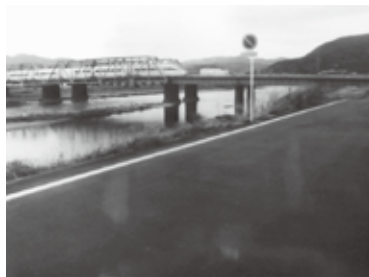
「十文字渡しの沢尻の土手」

この吉田島の大長寺前の小田急沿線沿いの道は、『馬道』(小田原道)と称され、松田の庶子からの道でもあり、この矢倉沢往還の人馬に混じり小田原まで年貢米等を背負った多くの馬が行きかかってきたそうです。(開成町文化財保護委員・久保田氏談)