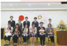
松田さくら保育園 (4月1日)

4月中旬に、町内の保育園、幼稚園、小・中学校で入園・入学式が行われました。皆さん、おめでとうございます!