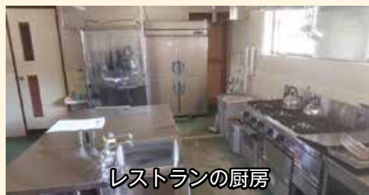
レストランの厨房

昨年の本紙9月号と先月4月号でお知らせしましたとおり、寄地区に雇用や賑わいを創出するために、町は平成28年度から「Yadoriki Healing Village事業」を推進しています。寄ふれあいドッグランをリニューアルし、寄地区を多くの愛犬家で賑わう「癒しの里」にする一大事業です。