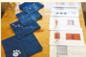
藍染めドッグバンダナなど