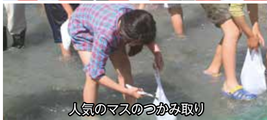
人気のマスのつかみ取り