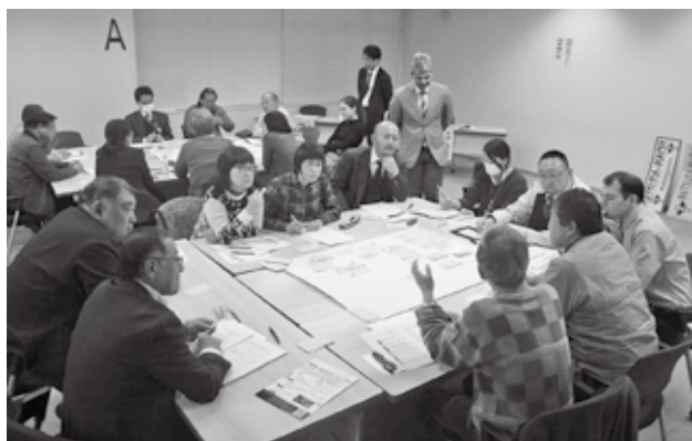
調査員による報告のあと、2班に分かれて討論しました。

3月28日(火)に、町役場の会議室にて、2月24日(金)～25日(土)の1泊2日で行った「松田町国際交流ツアー」の結果報告会を開催しました。