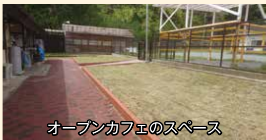
オープンカフェのスペース