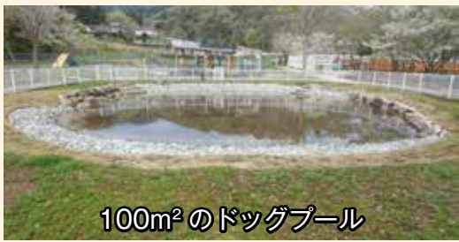
100m 2 のドッグプール