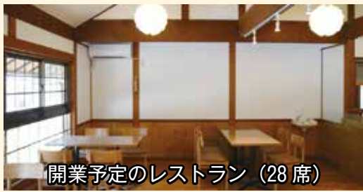
開業予定のレストラン (28席)