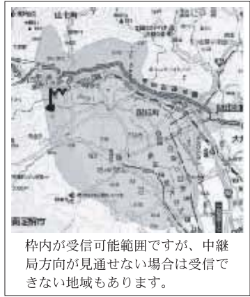
枠内が受信可能範囲ですが、中継局方向が見通せない場合は受信できない地域もあります。