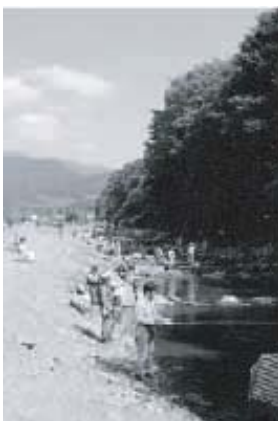
※写真は昨年のマス釣り大会

日時 3月30日(日) 午前9時~12時(小雨決行・雨天中止) 場所 松田町寄自然休養村養魚組合マス釣り場 対象 小学生とその保護者25組 参加費 1人500円(貸し竿・針・糸・おもり・えさ代など) ※釣った魚はすべて持ち帰れます。 持ち物 タオル・帽子・長靴(運動靴でも可) ※自分の釣り竿持参も可 はがきまたはFAXで、参加者の住所・氏名・年齢・電話番号を記入のうえ、「親子釣り教室参加希望」と明記して下記までお申し込みください。 《寄自然休養村養魚組合》 〒258-0001 神奈川県足柄上郡松田町寄5573 FAX 0465-89-2387 締切 3月22日(土) 必着