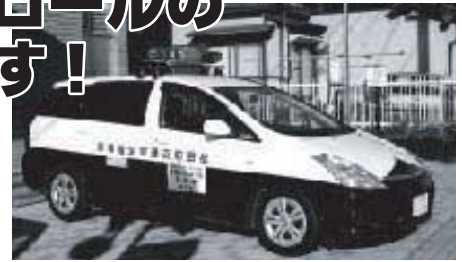
※写真は青色回転灯装備の町交通安全指導車

一般の自動車に回転灯を装備することは法令で禁止されていますが、警察により自主防犯パトロールを行うことを許可された団体は青色回転灯の装備が認められています。