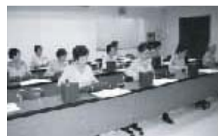
「大正琴コンサート(第1回)」(昨年)