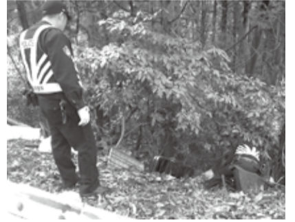
警察による現場の確認

不法投棄とは、路上や河川などの公共用地や、宅地・山林・畑などの民有地に不法にごみを投棄することです。ごみ集積場所における正しく分別されていないごみも含まれます。 不法投棄ごみで多いものは、町で引き取らないごみ、処理に費用が掛かるごみ、建築廃材、引越しごみ、弁当や飲料の空き容器、ポイ捨てされたタバコの吸殻などの散乱ごみです。 廃棄物の不法投棄は景観を損ね、悪臭を発生させるだけでなく、廃棄物の種類によっては周辺住民の方々へ深刻な影響をもたらす可能性があります。さらに、不法投棄を放置しておくことで、それが誘因物となり、さらなる不法投棄の温床にもなり得ます。 このような被害を減らすため、町では不法投棄されたごみの中から、捨てた人の手掛かりを探し出し、悪質な場合には警察と連携して、指導を行っています。