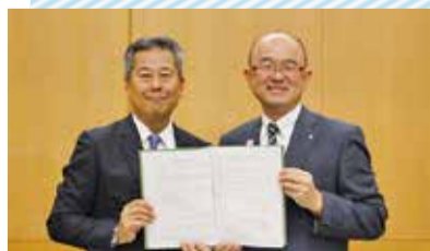
(株)講談社との協定調印式(8月17日)

富士フィルム(株)メディカル事業部(健康増進対策)と(株)講談社(教育環境の充実)とそれぞれ包括連携協定を締結しました。(エネルギー施策に関する協定については10月号にてお知らせ)