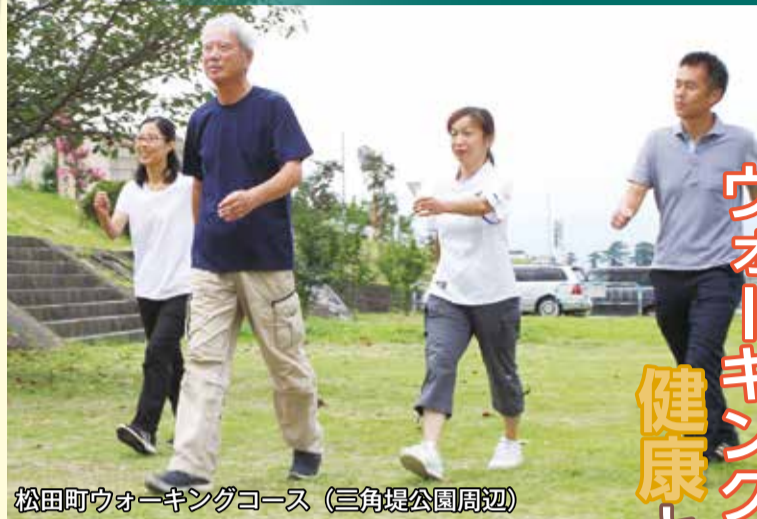
松田町ウォーキングコース (三角堤公園周辺)