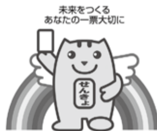
未来をつくる あなたの一票大切に