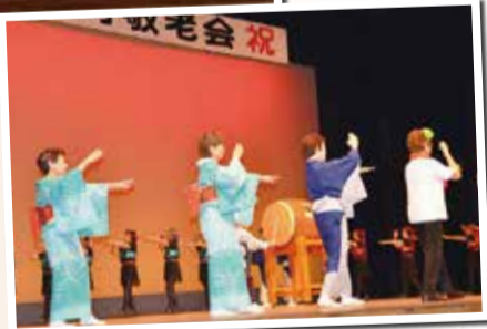
フィナーレの松田音頭▶

高齢者の長寿を祝い、多年にわたり社会の発展に寄与されたことに感謝の意を表す「敬老会」を9月18日「敬老の日」に開催します。当日は、町民有志による歌や踊りに加え、神奈川県警音楽隊による吹奏楽の華やかな演奏、振り込め詐欺防止の寸劇などが披露される予定です。