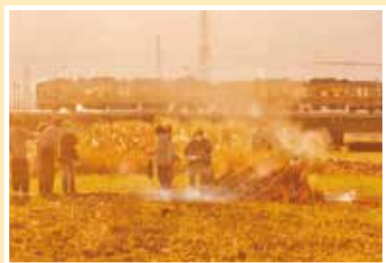
第1回 入賞作品 「ドンド焼き」