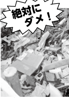
町内で発見された、不法投棄のごみ

不法投棄とは、路上や河川などの公共用地や、宅地・山林・畑などの民有地に不法にごみを投棄することです。ごみ集積場所における正しく分別されていないごみも含まれます。 不法投棄ごみで多いものは、町で引き取らないごみ、処理に費用が掛かるごみ、建築廃材、引越しごみ、弁当や飲料の空き容器、ポイ捨てされたタバコの吸殻などの散乱ごみです。 廃棄物の不法投棄は景観を損ね、悪臭を発生させるだけでなく、廃棄物の種類によっては周辺住民の方々へ深刻な影響をもたらす可能性があります。さらに、不法投棄を放置しておくことで、それが誘因物となり、さらなる不法投棄の温床にもなり得ます。 このような被害を減らすため、町では不法投棄されたごみの中から、捨てた人の手掛かりを探し出し、悪質な場合には警察と連携して、指導を行っています。