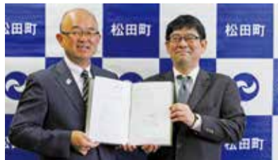
富士フィルム(株)メディカル事業部との協定調印式(7月24日)

富士フィルム(株)メディカル事業部(健康増進対策)と(株)講談社(教育環境の充実)とそれぞれ包括連携協定を締結しました。(エネルギー施策に関する協定については10月号にてお知らせ)