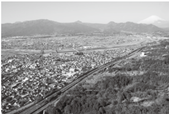
町の未来を一緒に考えましょう