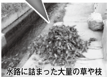
水路に詰まった大量の草や枝

刈り払った草や、剪定した枝などを水路に捨てると、下流で詰まり、悪臭や水路があふれる原因となります。