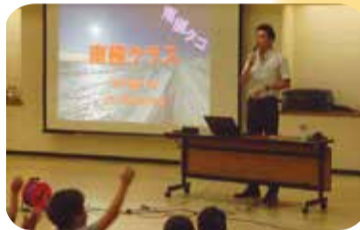
「南極クラス」は大人も子供も楽しめました。

7月から8月にかけて、「寺子屋まつだ 夏休みの巻」を実施しました。18種類の講座に延べ約千人のお子さんが参加し、普段できない体験を楽しみました。特に8月5日の「南極クラス」は、元南極観測隊員の方から南極での暮らしや、地球温暖化問題などを学ぶことができました。