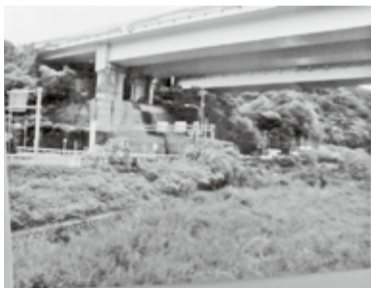
国道246号線と淵付近

「下茶屋（しもんちゃや）」の道標について（その三） 下茶屋、案内板の解説にある「淵」については、松田山裾野の国道246号線ができる以前の昭和30年代の頃、松田山の直下（写真参照）に存在し、小・中学生たちにとって水泳をするには大変都合の良い深さ約1メートル、川幅3～4メートルで、長さは約30メートルでした。 しかし、今は東名の橋脚や平成の初めの籠場橋架け替え工事の為に、川の流路を変えてしまったことなどから、写真の通りで「淵」の原形をとどめていません。 この場所は、バス停「籠