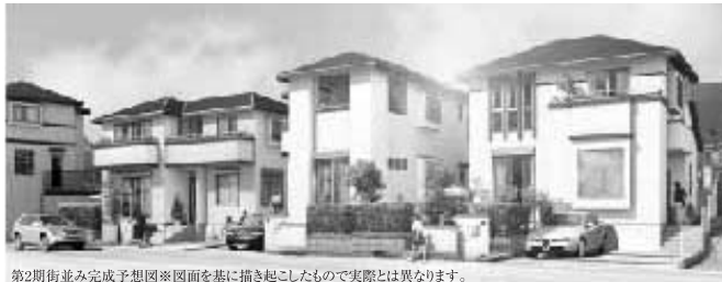
第2期街並み完成予想図※図面を基に描き起こしたもので実際とは異なります。