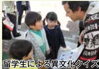
留学生による異文化クイズ