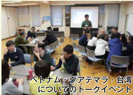
ベトナム・グアテマラ・台湾についてのトークイベント

米陸軍基地キャンプ座間の小学校に行き、子どもたちと直接触れ合うことで英語に慣れ親しみ、国際感覚を養うための交流会です。 実施日 3月21日(水・祝) 勉強会 1月13日(土)・20日(土)ほか(全6回) 対象 町民文化センターにて午前9時から小学校4年生～中学校2年生(定員30人・昼食代は個人負担) 【申し込み】 教育課 生涯学習係 ☎(83)7021