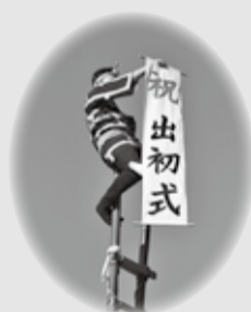
華麗なはしご乗りも行われます

1月7日(日)午前10時から酒匂川町民親水広場にて行われる消防団出初式において、長年消防団活動に従事され、特に優秀な成績を収めた消防団員の表彰を行います。