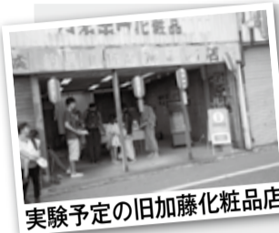
実験予定の旧加藤化粧品店

町では、国の地方創生交付金を活用し、県西地域北部の交通の要衝である駅周辺エリアが、広域で潜在力や波及効果を発揮するための調査及び構想策定を進めています。この事業の一環として、同エリアに不足している休憩・案内機能の確立に向けて、新松田駅前の空き店舗での実証実験を2月から3月にかけて予定しています。実験にあたって必要な改修工事を行いますので、ご理解とご協力をお願いします。