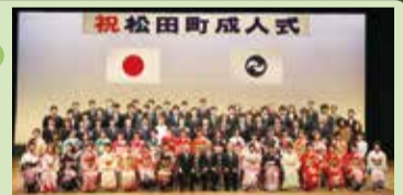
20歳の思い出づくりをしましょう

成人式は大人になったことを自覚する機会として、新成人による二十歳の抱負の発表、思い出を回想するムービーの上映などを行います。町外在住の方も、申し込みいただければ参加できます(観覧自由)。