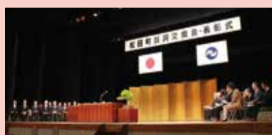
華やかに新年をお祝いします

賀詞交換会とあわせ、町の発展のために寄与された方々の功績をたたえ、表彰式を執り行います。