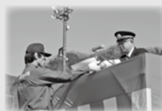
昨年の表彰の様子