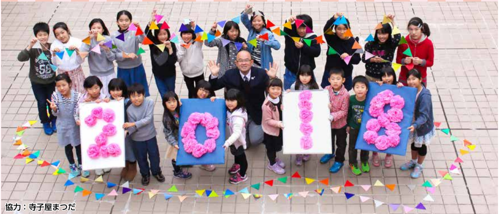
協力：寺子屋まつだ