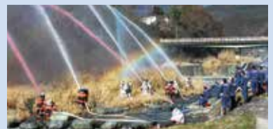
昨年の様子(みやま運動広場)

年に1度、町内の消防団が一堂に会し、ポンプ車などによる消防操法や、色とりどりの水による酒匂川への一斉放水を披露します。