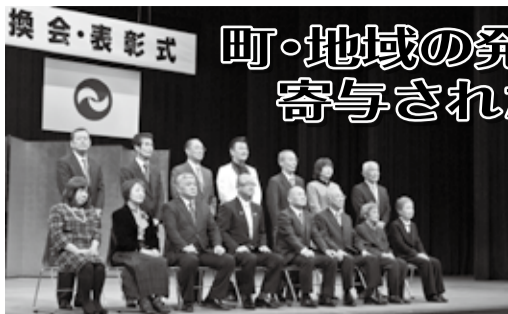
前回表彰を受けられた皆さん