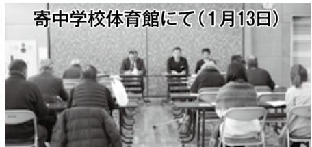
寄中学校体育館にて(1月13日)

(土)に町内3か所(湯の沢児童センター・寄中学校体育館・神山地域集会施設)において、町民説明会を開催しました。