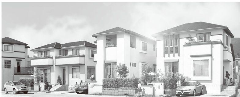
第2期街並み完成予想図※図面に基に描き起こしたもので実際とは異なります。