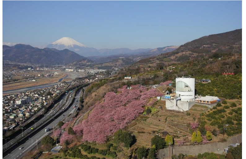
▲ 白亜のランドマーク「ハーブ館」を構え、14万人が来訪する桜まつり会場でもある西平畑公園