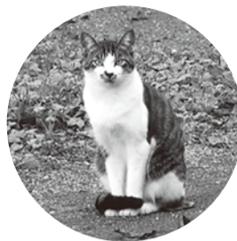
猫と人が幸せに共存する道を探します。

「地域猫」とは、地域で管理し、飼われている猫のことです。「野良猫に餌やりをしているけれど苦情がくる」「猫のフンで困っている」などの野良猫を巡るトラブルを「地域の問題」としてとらえ、猫が好きな人も苦手な人も含めた、地域の方すべての理解と協力のもとに「猫を『命あるもの』として適正に管理しながら共生していく」という考えに基づいています。