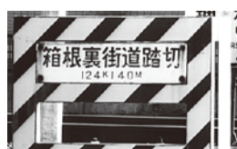
写真① 当町の踏切名も「矢倉沢街道踏切」としていただけていれば、より多くの方がご理解・納得を得られたのではないのでしょうか。

そして、懸案であった「矢倉沢以西から沼津までの道の呼称」については、随所に設置された表示板により「矢倉沢通り」であることが判明いたしましたが、「矢倉沢通り」と言っても当地のように、場所場所により「甲州街道」「鎌倉街道」「箱根裏街道」などと横に小文字で書き添えてありました。この表示の設置団体は「NPO富士山御殿場ガイド・御厨（みくり）の風」（写真②）です。 次回は本連載の最終回となります。