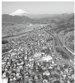
松田町の発展のために、一緒に頑張りましょう!