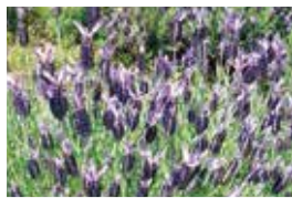
ハーブガーデンのラベンダー