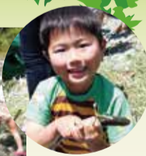
見事にマスを捕まえました！

今年の若葉まつりには約8,800人の方が訪れました。多くのご家族連れなどが清流・中津川での川魚のつかみ取りやステージショーを楽しみ、寄地区は一日中子どもたちの歓声で賑わいました。