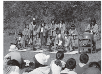
⑪ 寄神社祭囃子 (無形文化財)