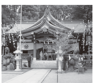
⑫ 寒田神社 (史跡)