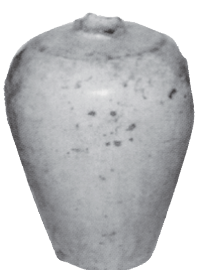
⑨ 梅瓶壺 (鎌倉後期・松田庶子800・大蔵院)