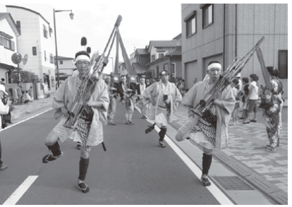
⑩ 松田町大名行列 (無形文化財・8月22日(土) 観光まつりで披露)