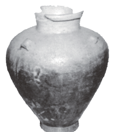
⑧ 三耳壺 (鎌倉中期・松田庶子800・大蔵院)