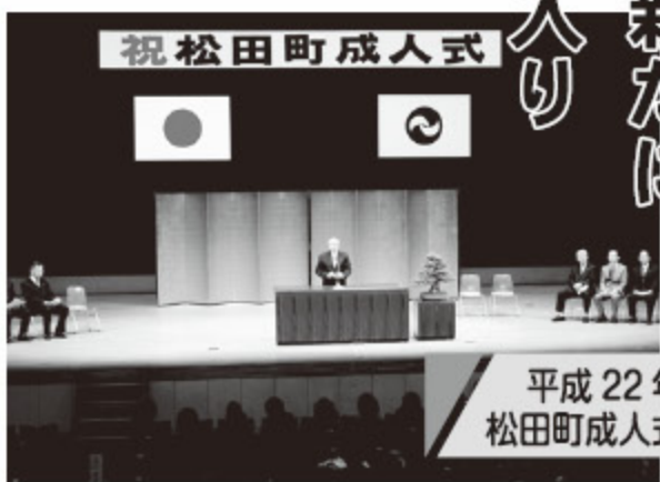
平成22年松田町成人式

最後に、今日まで私たちを育て、励まし、ご指導くださった家族や先生方、地域の皆様へ感謝を伝えたいと思います。私たちはこれからそれぞれの