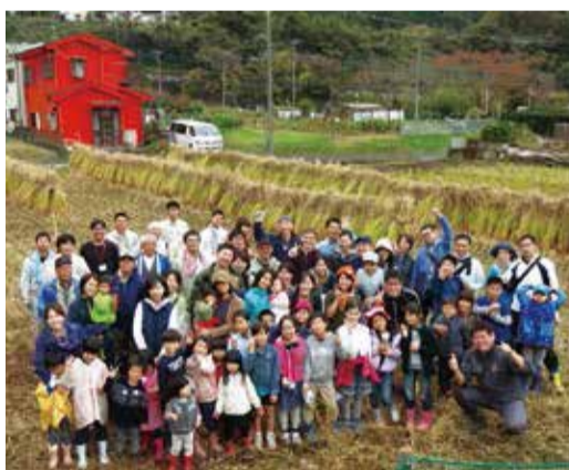
収穫・稲刈り体験イベントに参加された皆さん

寄地区(弥勒寺)での酒米づくり 日本酒の原材料となる酒米の栽培には、担い手不足により現在、耕作されていない寄地区の弥勒寺地内にある遊休田を活用し、地元農家の皆さんのご協力をいただきながら田植えから収穫