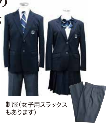
制服(女子用スラックスもあります)

来年4月に開校する松田中学校の制服が決まりました。決定に際しては、小学校4年生から中学校3年生までの児童・生徒、保護者および教職員のアンケート結果を参考に、学校関係者や保護者、地域代表を含めた検討部会、統合準備委員会で協議を行いました。 新しい制服は、ブレザー、スラックス、スカート、ネクタイ、リボン、エンブレム(記章)で構成されています。ブレザーは長時間着用しても疲れにくい素材を選びました。また、女子については、防寒対策などを考慮して、スカート以外にスラックスも選択できるようにしました。