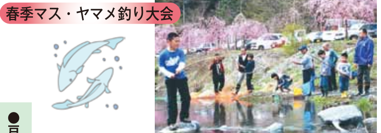
春季マス・ヤマメ釣り大会