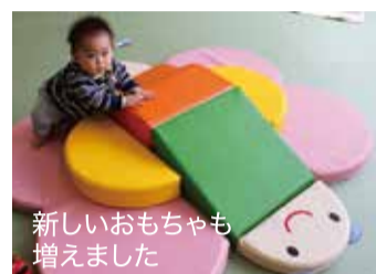
新しいおもちゃも 増えました

「女性が輝き活躍できる場所」をテーマに整備を進めていた、松田町創生推進拠点施設(旧松田土木事務所)の工事が完了し、松田惣領郵便局のそばにあった「子育て支援センター」と「ファミリー・サポート松田」が移転しました。移転後初の開所日となった5月7日(火)には、この日を心待ちにしていた保護者とお子さんたちでにぎわいました。