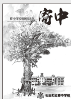
寄中学校閉校記念誌に描かれた大杉

寄神社例祭で奉納されます。担当するのは弥勒寺・虫沢田代・大寺宮地・三ヶ村の4つの保存会で、大太鼓・締太鼓・笛を使った演奏です。