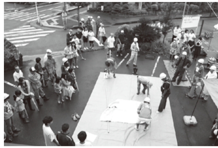
町屋自主防災会の訓練(昨年の様子)