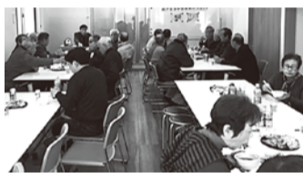
今年の新年会の様子

毎年1月1日の午後から実施しています。地域の皆さんとの新年のご挨拶の場であり、親睦を兼ねてビンゴゲ