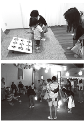
親子で輪投げゲーム 最後は花火で締めくくりました

ゲームの後には花火を行い、子どもから大人まで思い出し、残る夏のひと時を過ごすことができました。