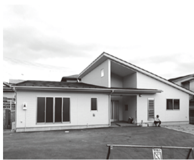
新しくなった谷戸地域集会所