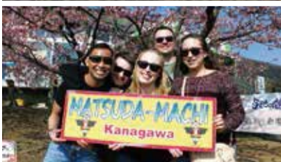
外国人ゲストと一緒にミッションに挑戦!

スカベンジャーハントって何?! 米国で最もポピュラーな、チーム参加型のレクリエーションゲームです。