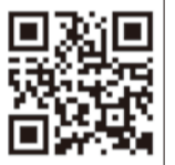
熱中症予防情報サイト

今年も暑い夏がやってきました。熱中症は、屋外で活動しているときだけでなく、就寝中など、高温多湿の室内でも発症することがあります。症状としては、筋肉痛、大量の発汗、吐き気、倦怠感などで、重症になると意識障害が起きますので、皆さん十分にご注意ください。もしも、「自力で水を飲めない」、「意識がない」といった場合は、直ちに救急車を呼びましょう。環境省の「熱中症予防情報サイト」に、詳しい対策が掲載されていますので、ぜひ参考にしてください。 【問い合わせ】 子育て健康課 健康づくり係 ☎(84)5544