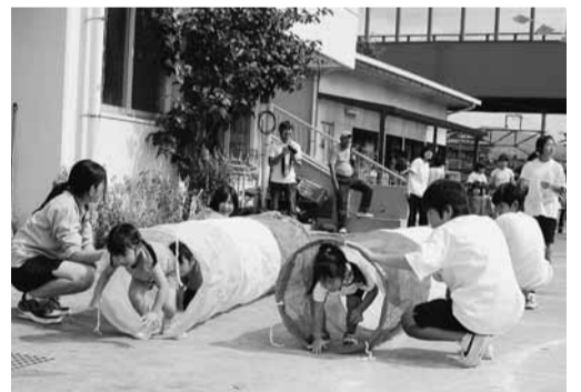
中学生が幼稚園の運動会のお手伝い