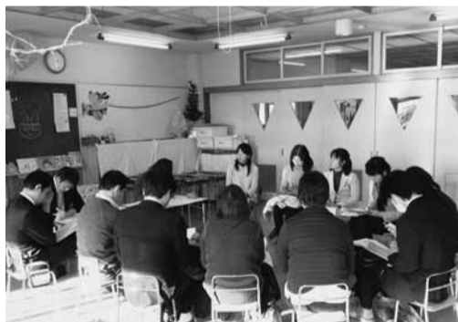
幼・小・中の先生方の合同研究会