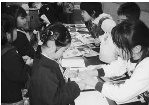
幼稚園児と小学生の交流会