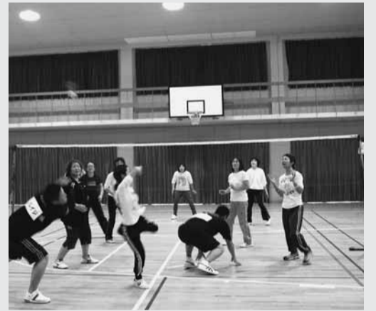
昨年のインディアカ大会