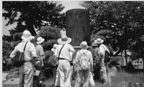
松田の歴史探訪で碑を見学

生涯を通して、自分の学びたいことを、自分にふさわしい方法で学びながら、豊かな日々を過ごす方が増えていきます。教育委員会では、今年も、皆さんのニーズに少しでも応えることができるような事業を計画しました。各事業の詳細は、その都度「広報まつだ」「お知らせ号」「町のホームページ」等でお知らせします。