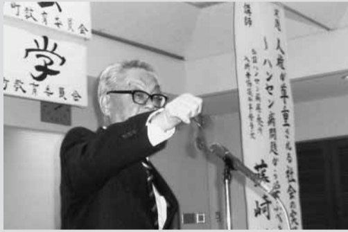
昨年の人権教育研修会