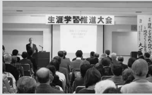
生涯学習推進大会