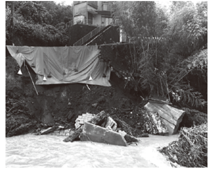
中津川(湯の沢地区)

令和元年10月12日から13日にかけて、神奈川県に上陸した台風19号は、町内でも記録的な暴風雨となりました。特に寄地区田代橋付近では、12日の19時から20時までの降雨量が1時間47mmを越え、降り始めからの総雨量が約450mm降り、また最大風速28m以上の暴風も記録しました。この暴風雨により町内各地区では甚大な被害が発生し、寄地区においては、家屋・小屋などへの被害や道路は土砂崩落により通行止めとなり、一時孤立状態となりました。