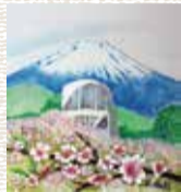
「桜葉わいん」のラベル