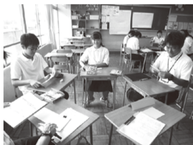
生徒と先生と一緒に今日の授業の検討を行う

割を見直すことなども重要です。昔から使われてきた言葉ではなく、「教科書を教えるの」ではなく、「教科書で教える」授業となるように、チーム一丸となって研究を鋭意進めています。