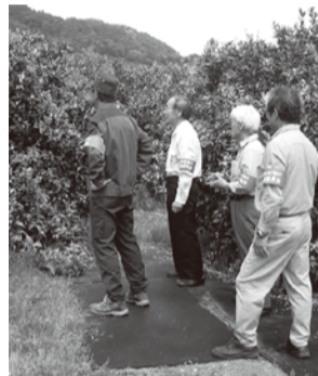
農地パトロールの様子

「要項」により、推薦・応募方法をご確認の上、所定の書類に必要事項を記入し、農業委員会事務局へ直接提出するか、郵送してください。