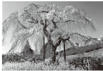
平成29年度 推薦「春のおとづれ」