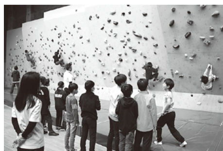
横芝光町との交流でのボルダリング

年6回の定例会をはじめ、体育協会主催の各種スポーツ大会への協力や西湘地区、足柄上地区で行われた研修会への参加を通して、委員としての職責を改めて確認することができました。