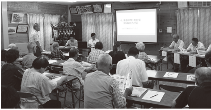
多くの皆さまが町政や町の将来について、熱い想いを語ってくださいました。(写真は仲町屋地域集会施設での座談会の様子)