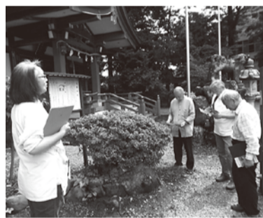
寒田神社宮司さんからお話を伺う

また、今年度は町内矢倉沢往還3コースの内の2コースに当たる神山清水の山王社と町屋の山王社境内に