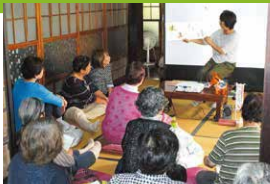
「地域の茶の間」の活動の様子

編集・発行 松田町政策推進課 〒258-8585 松田町松田惣領 2037 番地 ☎0465-83-1222 ☎0465-83-1229