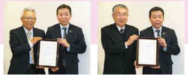
目録を受け取る東城代表幹事(左)と辻村代表(右)

(公財)大和証券福祉財団が実施している「ボランティア活動助成」により全国183団体(うち神奈川県13団体)が助成を受けました。