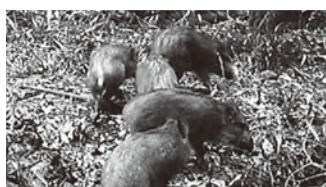
町内の畑を荒らすイノシシ

近年、野生鳥獣による農作物被害が増加しています。有効な被害防止対策を講ずるためには、皆さまの被害届に基づく正確な被害状況の把握が必要です。農作物の被害があった際は、被害届の提出にご協力をお願いします。