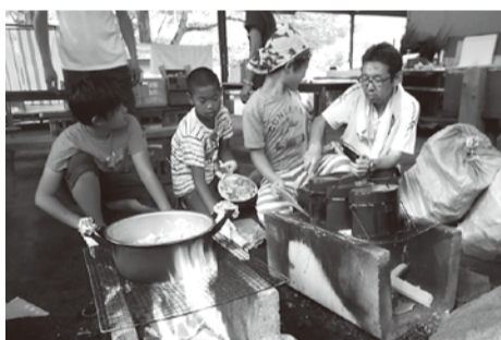
ジュニアキャンプでの夕食の準備

年10回程度の定例会、夏のキャンプや秋の体験事業の開催、町事業(観光まつり、夏フェス、文化祭等)への参加や事業開催時にお