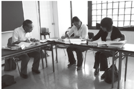
アンケートの集計

社会教育委員会会議は、昨年度改選を行い、現在14人(定員15人)の委員で活動しています。メンバーは、町校長園長会や公民館登録サークル、自治会長連絡協議会、PTA会長会、町体育協会、青少年指導員会、スポーツ推進委員会の代表者および学識経験者や小中学校の保護者の方で構成されています。 年6回の会議のほか、町文化祭への参加や放課後子ども教室の運営への参加、研修会への参加を通し、生涯学習の現状について学んでいます。 また、職務の一環である