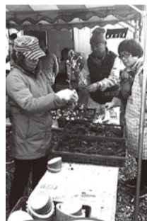
3月20-21日には体験宿泊モニターツアーを企画中です!

今年も約2万5千人が訪れたロウバイまつりでは、風車と苔玉づくりを体験プログラムとして出店したところ、大勢の方で賑わい、テレビ局の取材も受けました。