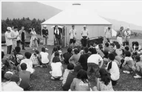
ジュニアキャンプ教室