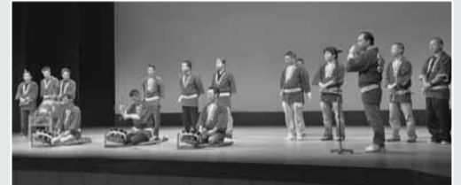
芸能発表もにぎやかに