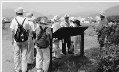
文化財ウオーキング