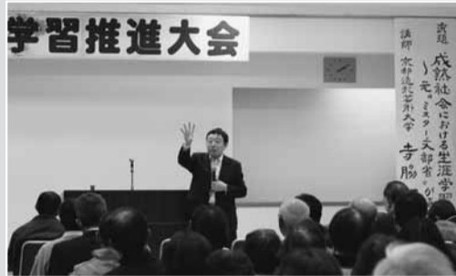
生涯学習推進大会